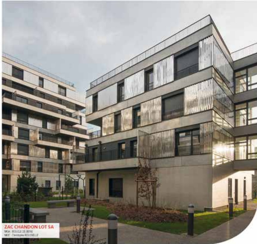
ZAC CHANDON LOT 5A MMA - BOULEVARD DE DEBAS MSE - GENNEVILLIERS