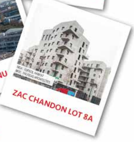
ZAC CHANDON LOT 8A