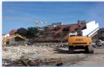
Guyot 1 Montreuil