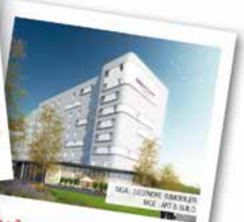
HÔTEL MERCURE / IBIS