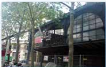
Verrière Marché du Templeier - Paris