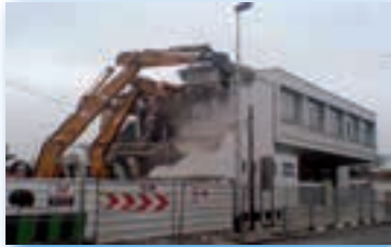
CPAM Le Blanc-Mesnil

MURAGE - CLOTURE - NETTOYAGE - ETAIEMENT CONFORTATIF DEPOLLUTION - DESAMANTAGE