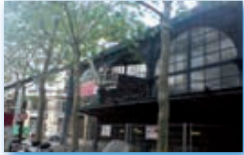
Verrière Marché du Templier - Paris