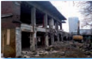
Orée du Bois - Porte Maillot