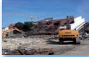
Guyot 1 Montreuil