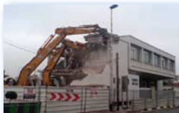
CPAM Le Blanc-Mesnil

MURAGE - CLOTURE - NETTOYAGE - ETAIEMENT CONFORTATIF DEPOLLUTION - DESAMIANTAGE