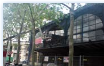
Verrière Marché du Templier - Paris