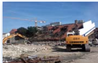
Guyot 1 Montreuil