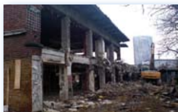
Orée du Bois - Porte Maillot