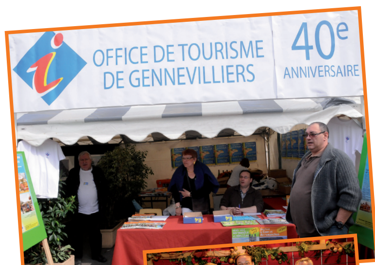
Les bénévoles de l'OTSI au Marché de printemps, le 9 mai dernier et à la Foire aux vins, cru 2008

L'Office de Tourisme informe aussi sur les séjours à la carte.