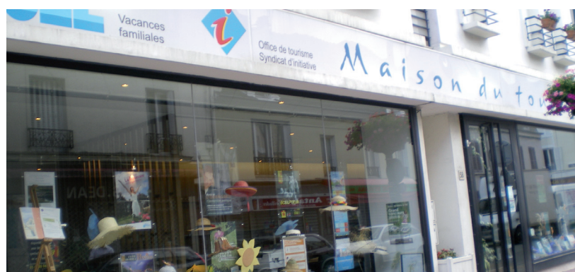
L'OTSI est installé depuis 2001 dans les locaux de la toute nouvelle Maison du tourisme

Pour ce faire, l'OTSI travaille, depuis de nombreuses années, avec « Spectacles et loisirs », organisme qui répertorie les spectacles en Ile-de-France et avec l'ensemble des Offices de tourisme et syndicats d'initiative de France, pour obtenir des informations sur un gîte, un camping