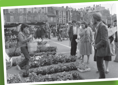
Le Marché aux fleurs devenu le Marché de printemps

Au fil du temps, au-delà des services qu'il rend quotidiennement (voir pages 5 et 7), les initiatives ont fleuri. En 1980, le premier Marché aux fleurs voit le jour. A cette époque, il prenait place avenue de la Libération. Avec, parallèlement, jusqu'en 2000, le concours des « Balcons fleuris », organisé en partenariat avec l'Office public HLM de Gennevilliers. Dix ans plus tard, le Marché aux fleurs, devenu le Marché de printemps, est transféré place du Village.