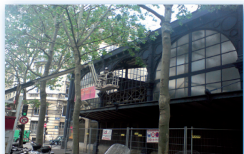
Verrière Marché du Temple - Paris