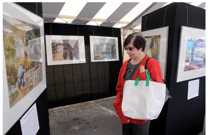
Exposition de toiles impressionnistes au Marché de Printemps, en mai dernier