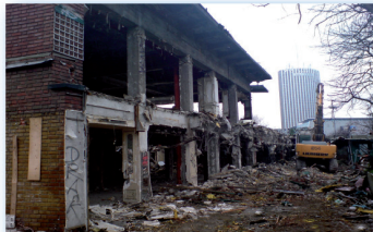
Orée du Bois - Porte Maillot