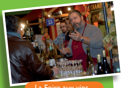
La Foire aux vins