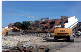
Guyot 1 Montreuil