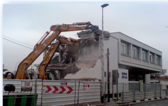
CPAM Le Blanc-Mesnil