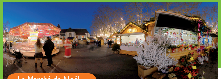
Le Marché de Noël