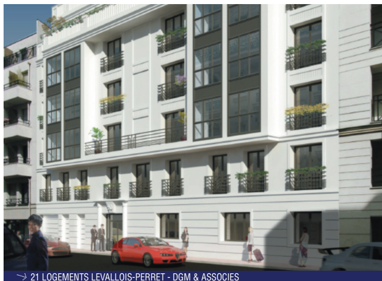
21 LOGEMENTS LEVALLOIS-PERRET - DGM & ASSOCIES