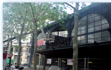
Verrière Marché du Templier - Paris