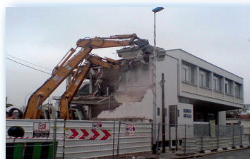
CPAM Le Blanc-Mesnil

MURAGE - CLOTURE - NETTOYAGE - ETAIEMENT CONFORTATIF DEPOLLUTION - DESAMIANPAGE