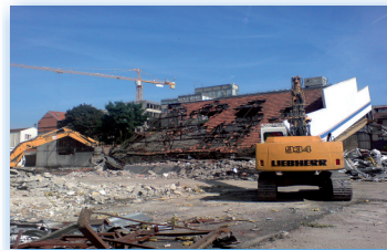
Guyot 1 Montreuil