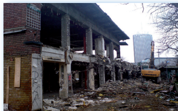
Orée du Bois - Porte Maillot