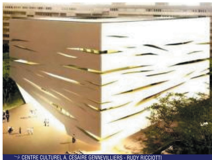
CENTRE CULTUREL A. CESAIRE GENNEVILLIERS - RUDY RICCIOTTI

50 avenue de la République 94550 CHEVILLY-LARUE CEDEX Tél. : 01 41 76 09 10 - Fax : 01 41 76 09 70 www.demathieu-bard.fr