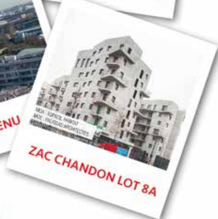
ZAC CHANDON LOT 8A