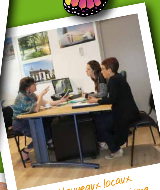
Nouveaux locaux de l'Office de Tourisme