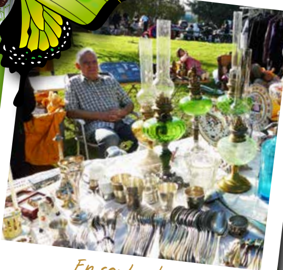
En septembre, la Brocante