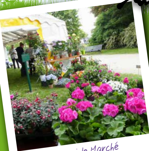
En mai, le Marché de Printemps