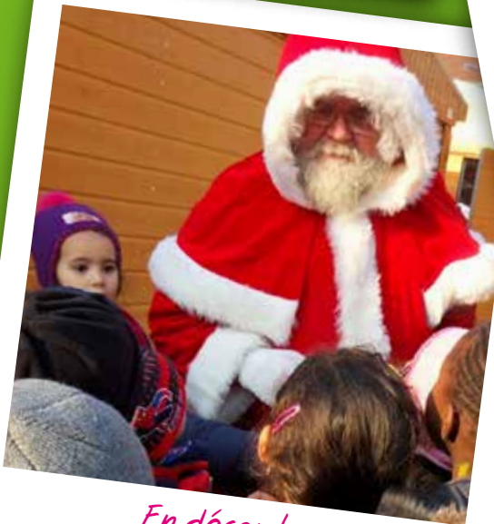
En décembre, le Marché de Noël