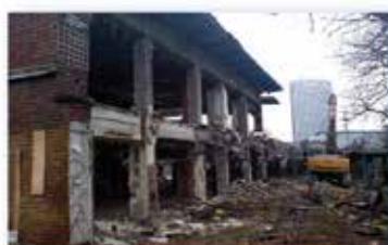
Orée du Bois - Porte Maillot

5, rue du Chevalier Saint-Georges - 75008 PARIS