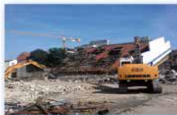
Guyot 1 Montreuil