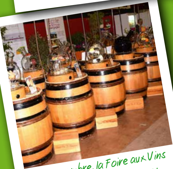
En novembre, la Foire aux Vins et aux Produits régionaux