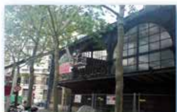
Verrière Marché du Temple - Paris