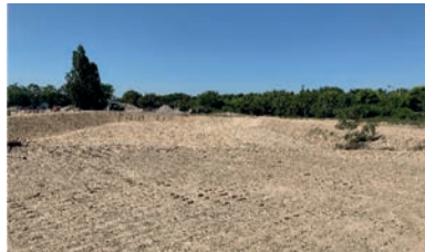
Terrassement et aménagement 60 000 m 2 - Gennevilliers