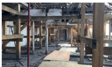
Etalement d'un bâtiment