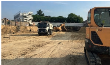
Dépollution 20 000 t - Neuilly Plaisance