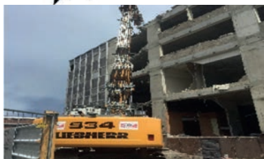
Démolition grand bras 24 m - Montreuil

VOTRE PARTENAIRE DEPUIS PLUS DE 30 ANS 7J/7J