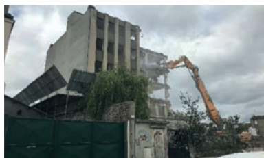
Démolition grand bras 28 m - Aubervilliers