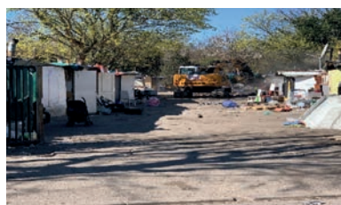
Sécurisation installation illicite

Etudes Réalisation Démolition Terrassement