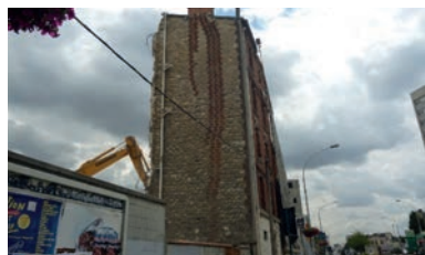
Démolition R+5 Semag