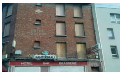
Sécurisation d'un bâtiment