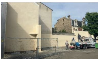
Protection enduit après démolition