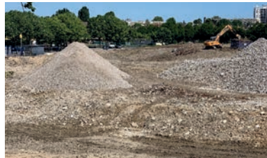
Piscine Olympique Aulnay démolition et dépollution 11 000 t