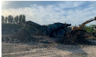
Criblage - Optimisation des terres