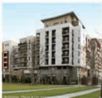
Résidence Central Park