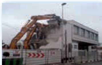
CPAM Le Blanc-Mesnil