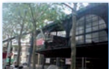
Verrière Marché du Templier - Paris