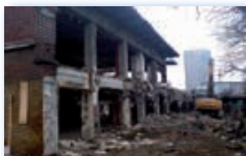
Orée du Bois - Porte Maillot