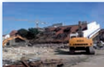
Guyot 1 Montreuil