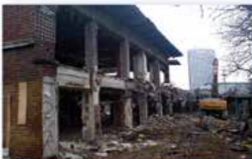
Orée du Bois - Porte Maillot

Agence de Gennevilliers 23, rue Félicie 92230 Gennevilliers Tél. 01 41 47 65 30 Fax 01 40 85 09 05