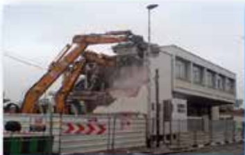
CPAM Le Blanc-Mesnil