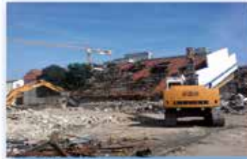
Guyot 1 Montreuil