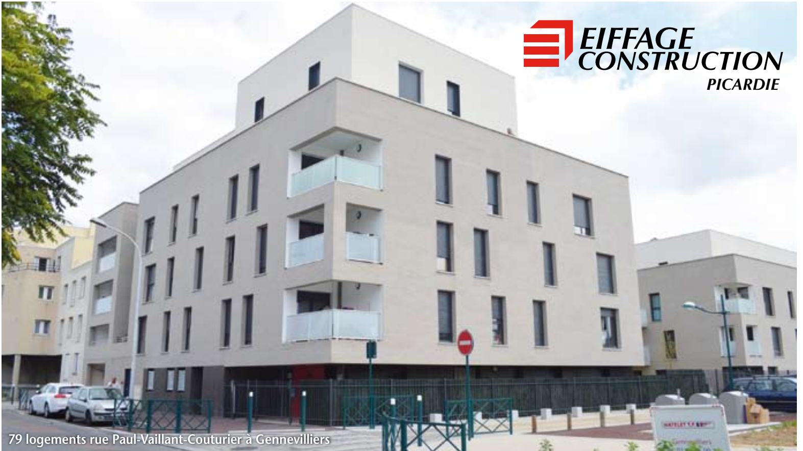
79 logements rue Paul-Vaillant-Couturier à Gennevilliers